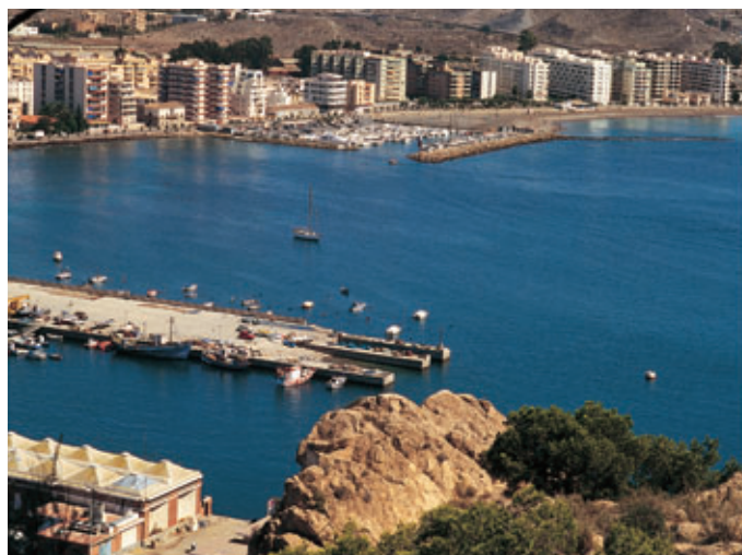
Puerto deportivo de Águilas. La población de la Región de Murcia se distribuye desigualmente, concentrándose en las áreas de mayor desarrollo económico.

El empleo masivo del automóvil provoca una gran demanda de espacio urbano acondicionado para su circulación y estacionamiento, lo que afecta a los nuevos trazados y a los cambios necesarios de las viejas calles.